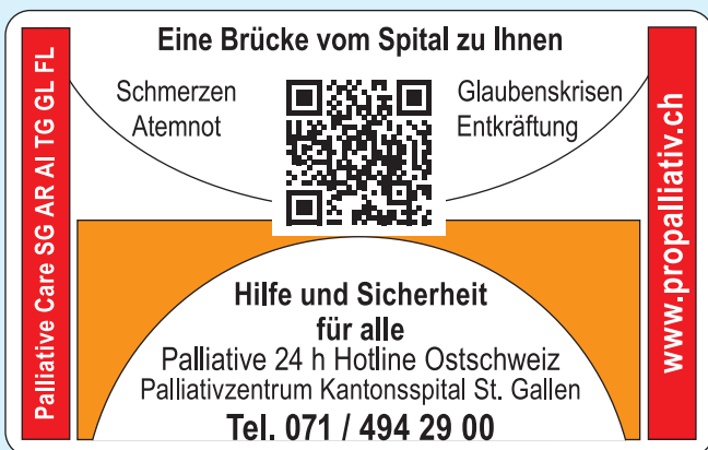
Palliativcard Angehörige, Freunde